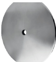
Linsentell Edelstahl geschliffen