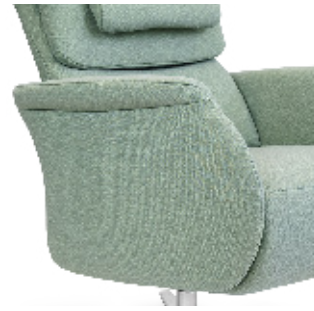
geschlossene Armlehne mit griffigen Flügeln