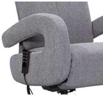
offene geschwungene Armlehne