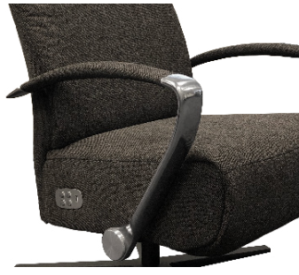
schmale offene Armlehne Chrom