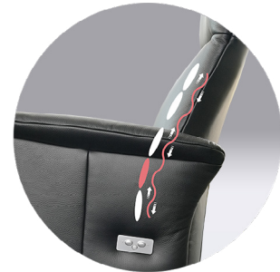
inklusive Luftkammer- Massage-System