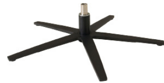
Sternfuß flach schwarz matt pulverbeschichtet