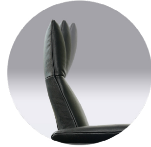
inklusive manueller Kopfteilverstellung