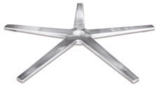
Sternfuß flach Edelstahl poliert