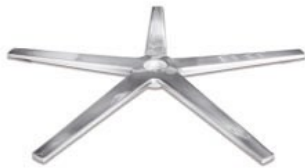
Sternfuß flach Edelstahl poliert