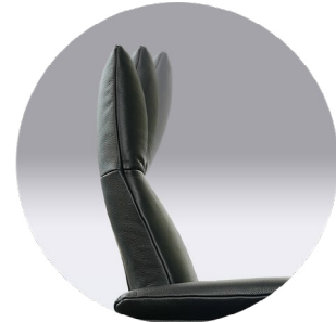
inklusive manueller Kopfteilverstellung