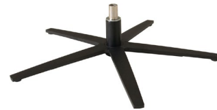
Sternfuß flach schwarz matt pulverbeschichtet